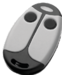
TR-2909 COCCINELLA 433-4 433,92 MHz Rolling Code