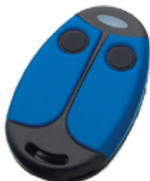
TR-2911 COCCINELLA 868-4 868,35 MHz Rolling Code